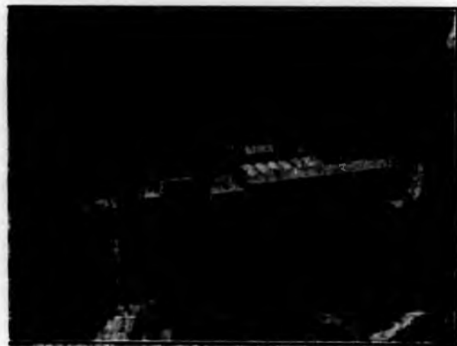
Stabilimento di Lusernetta

La ristrettezza dello spazio non ci può consentire una più ampia e dettagliata descrizione dell'opera della Ditta, però non possiamo tacere quello che il Cotonificio F.lli Turati ha fatto per l'assistenza delle sue maestranze, perchè facendo questo, verremmo meno al nostro compito che non è solamente quello di illustrare con aride cifre lo sviluppo di un'azienda, ma è anche quello di valorizzare al massimo grado gli sforzi che questi nostri industriali hanno fatto per creare quel benessere necessario alla maestranza affinchè essa sappia di non essere solamente sfruttata ai fini di un illecito arricchimento, ma guidata ed apprezzata per la sua tenace operosità. In questo campo la ditta ha dotato il suo stabilimento di Lusernetta di un convitto con 100 letti per le operaie che sono assistite dalle suore Francescane, ed ha inoltre costruito ampie e comode case con appartamenti modernissimi per gli operai e ha dotato i due stabilimenti di spacci di derrate alimentari.