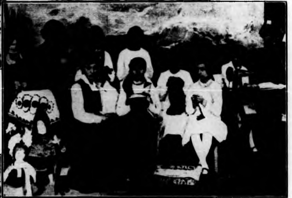
Sartoria - Confezioni di costumi regionali.