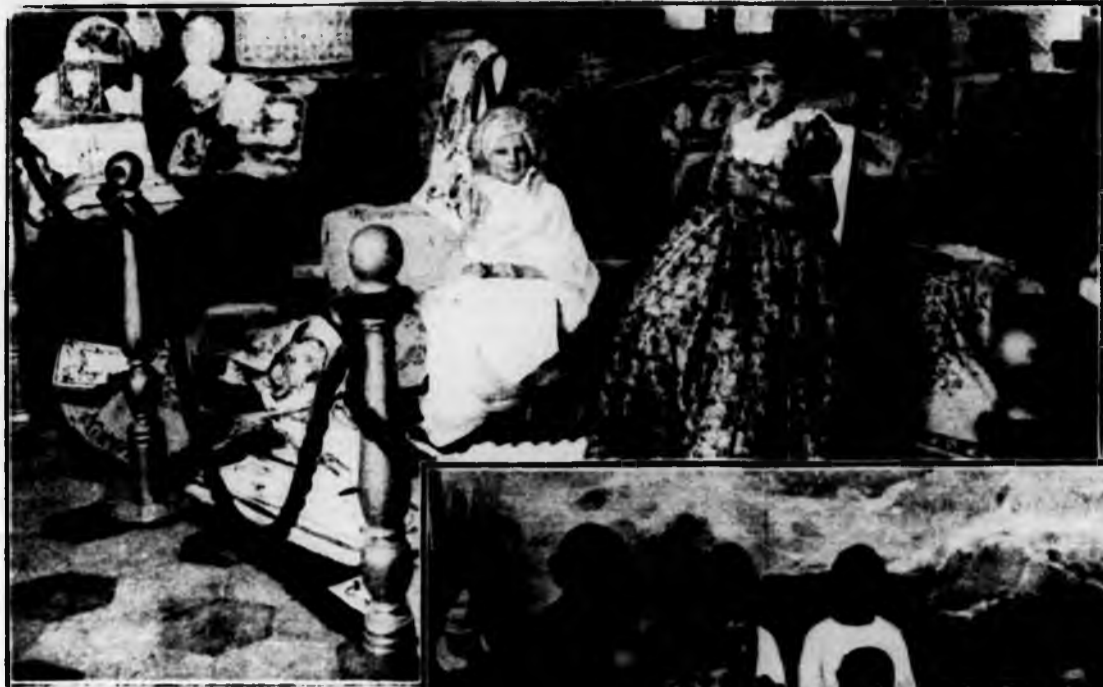
Lavori Piemontesi del 700: Barocco e Bandera.