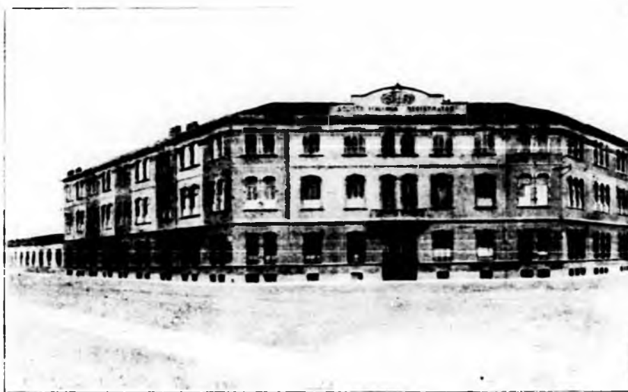
Veduta generale dello Stabilimento.

attrezzatura perfezionatissimi, si costruiscono Registratori di Cassa di tutti i tipi, da quelli economici richiesti dalle botteghe più modeste, fino