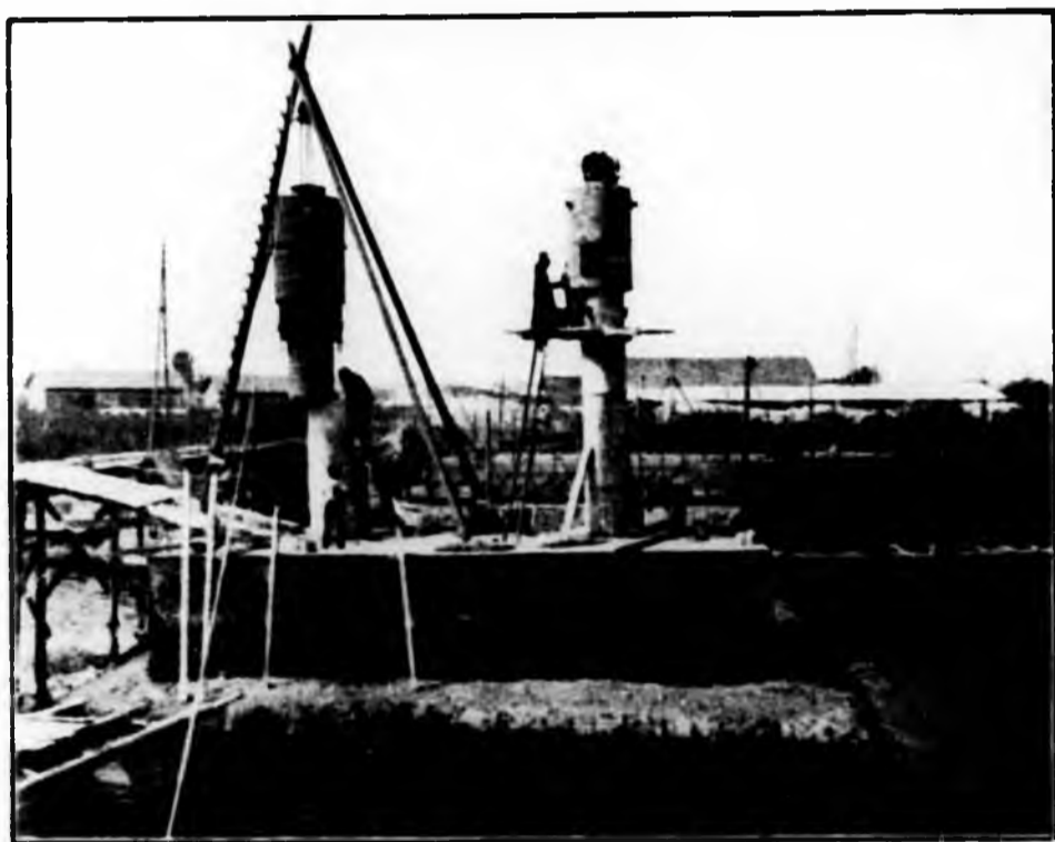
Ponte sul Po a Torino in Corso Belgio - Fondazioni ad aria compressa.

altre opere e di costruzioni di fabbricati di cui i Borini hanno, si può dire, cosparso il suolo d'Italia; alla forte Impresa adunque il saluto am-