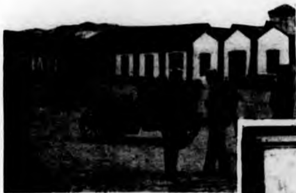
Lo Stabilimento Fiat nel 1900