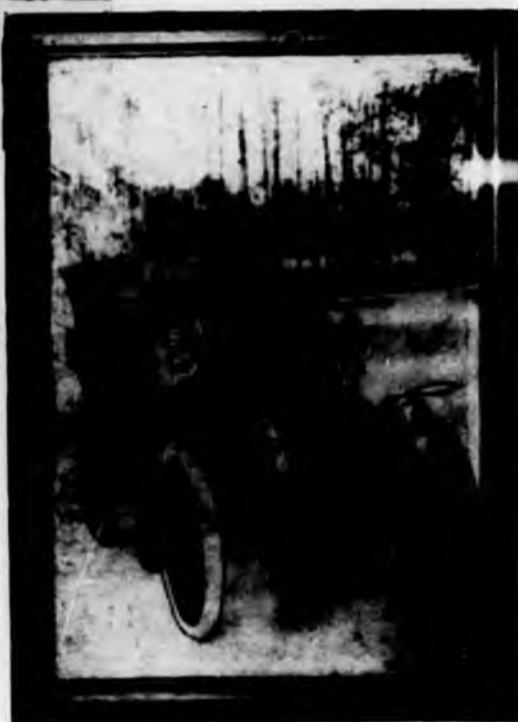
S. M. il Re su una delle prime Fiat

3000 operai. Gli impianti meccanici di queste Ferriere sono tra i più moderni esistenti oggi in Europa, con due gruppi di Forni Martin di una potenzialità produttiva di oltre 1000 tonnellate al giorno di acciaio, con treni Blooming da 950 mm., ecc.