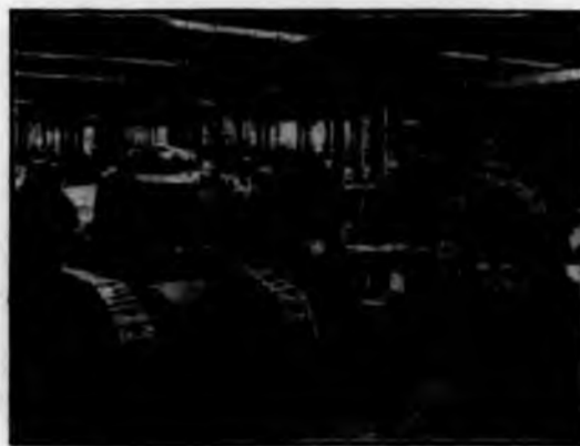
I Carri d'assalto Fiat