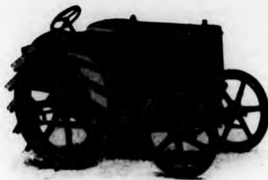
La trattrice agricola Fiat