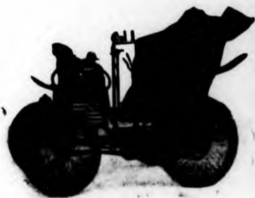
La prima Fiat