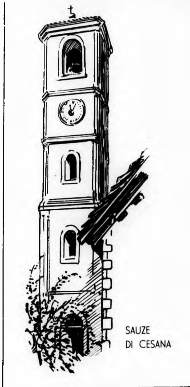
SAUZE DI CESANA

d'acqua i paesi sottostanti. Il paese ne parla con legittimo orgoglio, e gli episodi sono di commovente esempio. Dall'alto protegge il vecchio campanile, costruito nel 1433 dal Delfino di Francia. Esso segna esattamente i quattro punti cardinali. Quadrato di base finisce superiormente in una snella ed alta piramide ottagonale. Finestre ad una, a due, a tre luci, elegantiscono l'insieme.