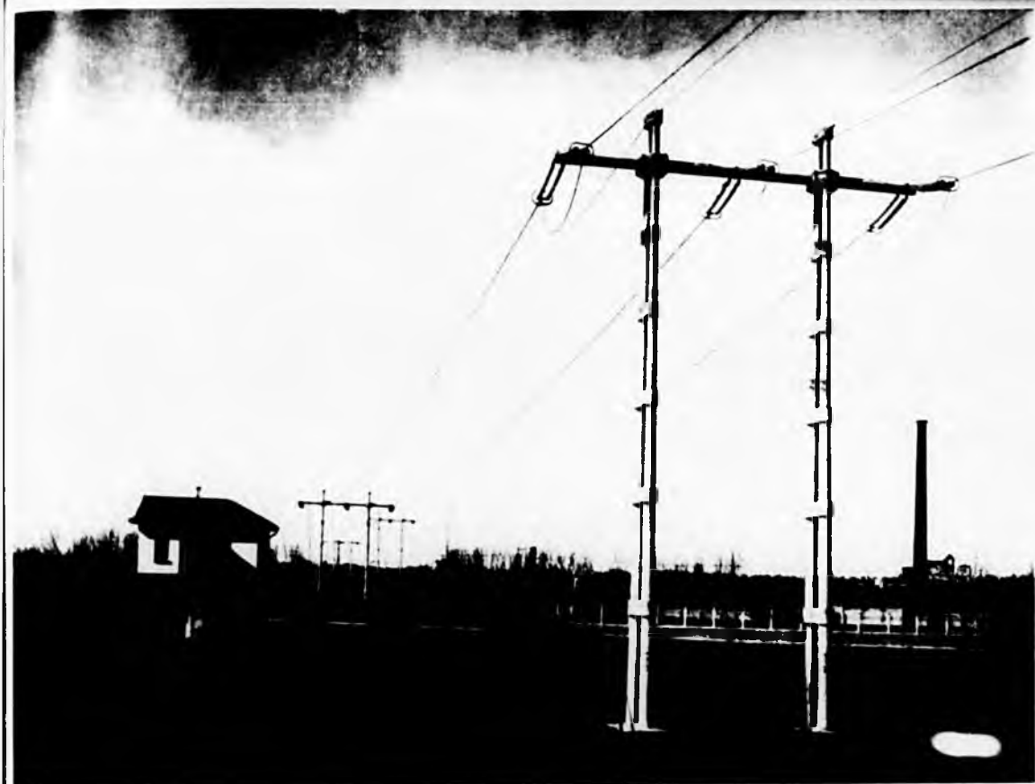
Fig. 5. Portale doppio di attraversamento in cemento armato centrifugato della linea 220.000 Volt Cardano - Turbigo