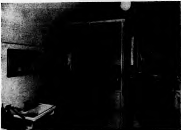
... sezione di batteriologia