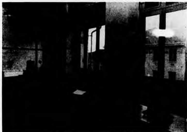
... sezione di anatologia ...