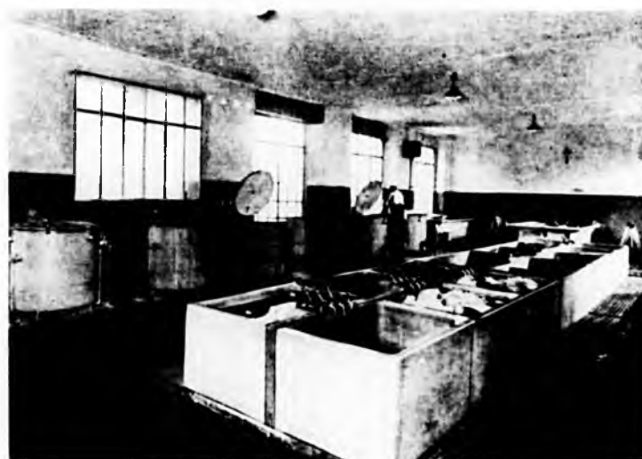
Lavanderia: vasche di macero e lavaggio