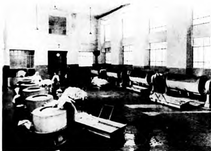
Lavanderia: idroestrattori e lavatrici

sono le religiose del Piemonte per acquistare la preparazione tecnica che le rende atte alla professione d'infermiera.