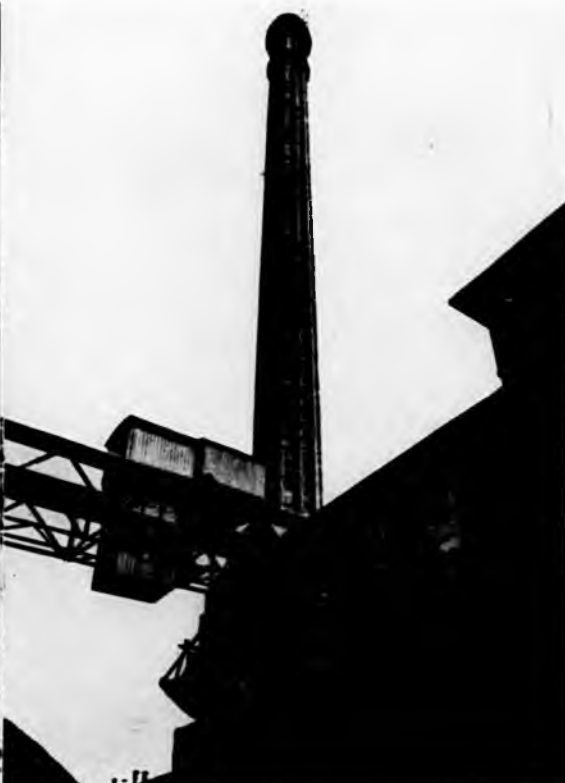
Centrale termica: gru e ponte