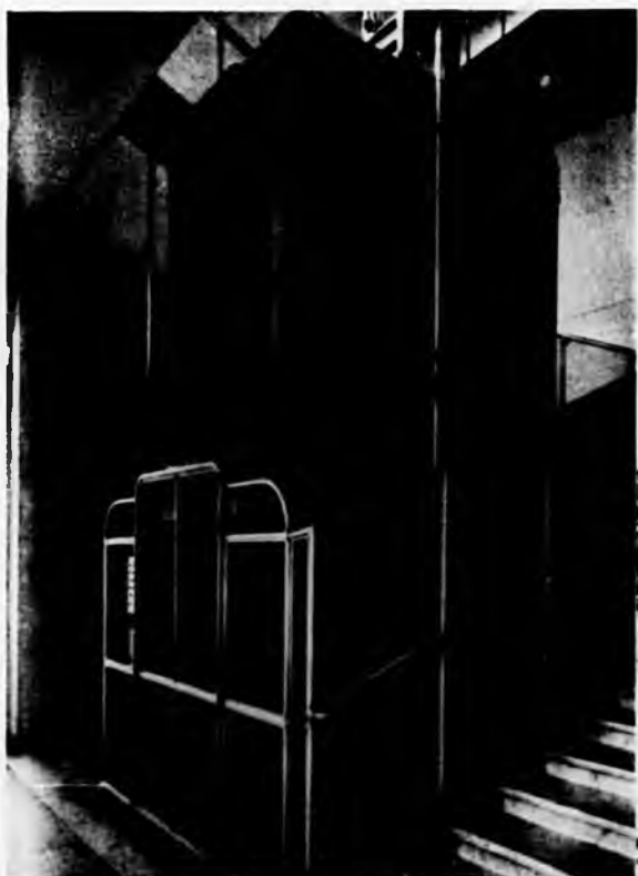
Tipo di monta ammalati