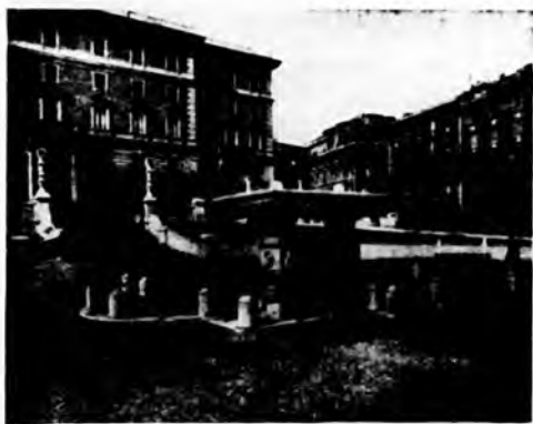
Roma - Piazza Feltrina - Pavimentazione in ciottoli di porfido tipo C