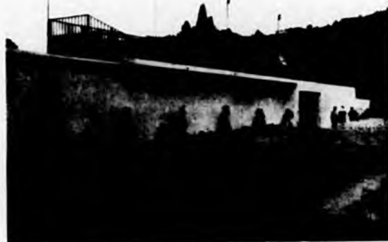
Palazzo della Moda: teatro all'aperto