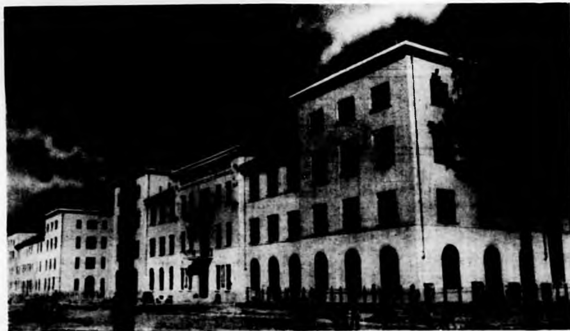
Il nuovo edificio della Regia Matera

3) Teatro all'aperto. - Consta di una vasta platea degradante verso il proscenio limitata da un lato