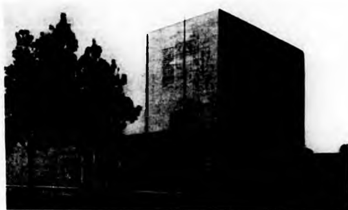
La sede del Gruppo Rilievi "Contra Odono."