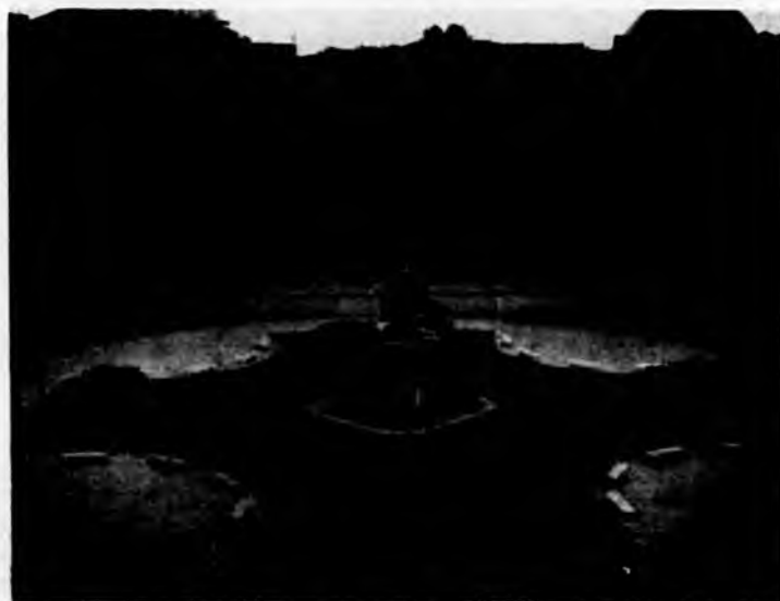
Piazza Carlo Emanuele II: nuova sistemazione

Ultimate le opere di risanamento della via Roma sono proseguiti gli studi per l'attuazione degli slarghi previsti dal Piano Regolatore della via Roma all'angolo della via XX Settembre con il corso Oporto, e all'angolo della via Andrea Doria con la via Lagrange.