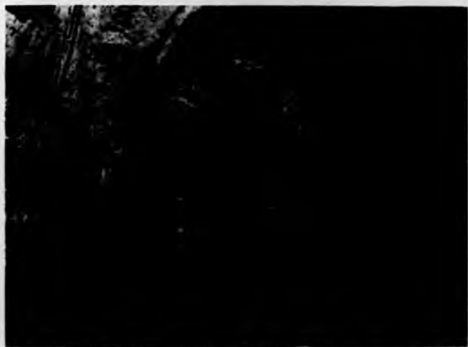
Condotto sotterraneo nel canale tratto di via Roma