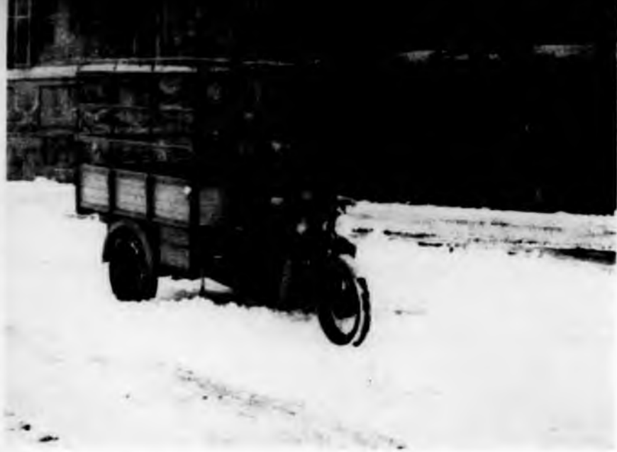
Motocarro con lama raschiante spazzaneve.